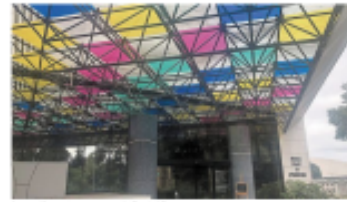
La sculpture est une œuvre de Daniel Buren.

Se verra pour évoquer le musée d'Art et d'Histoire