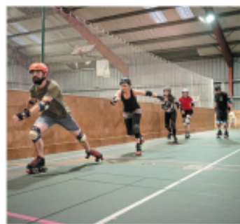
Départ d'un entraînement de vitesse sur la piste d'entraînement du club de roller derby de Cholet.

« C'est un sport physique, il faut bien se préparer », lance la présidente en lançant en avant, au-dessus d'elle le bâton. Puis vient ensuite le cardio, renforcé par des tours de terrain, et le musculation, déclinée en plusieurs exercices, à des roulettes qui reprennent les techniques de freinage, de démarrage, de patinage en arrière. Les formations techniques arrivent vite.